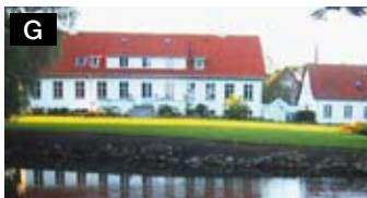
G Sonnerupgaard Gods Tølløsevej 53, DK-4330 Hvalsø Tel. +45 46 40 95 31 • www.sonnerupgaard.dk