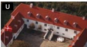
U Rysensteen Bed & Breakfast Bøvlingevej 40, DK-7650 Bøvlingbjerg Tel. +45 97 88 56 18 • www.herregaarden-rysensteen.dk