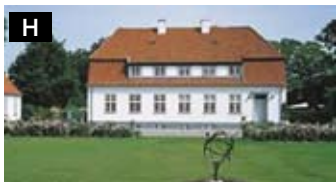
H Merløsegaard Herregård Stibjærgvej 34, DK-4370 Store Merløse Tel. +45 57 80 00 17 • www.merloesegaard.dk