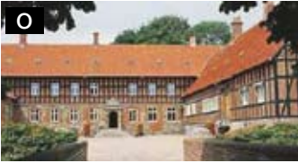
Broholm Broholmsvej 32, DK-5884 Gudme Tel. +45 62 25 10 55 • www.broholm.dk