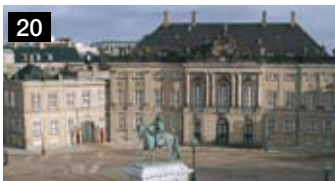
Amalienborg DK-1257 København K Tel. +45 33 92 64 92 • www.ses.dk