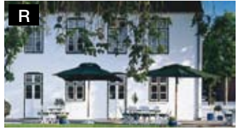
Steensgaard Herregårdspension Steensgaard 4, Millinge, DK-5600 Faaborg Tel. +45 62 61 94 90 • www.herregaardspension.dk