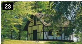
Sorgenfri Slotshave Kongevejen 8, DK-2800 Lyngby Tel. +45 33 92 63 00 • www.ses.dk