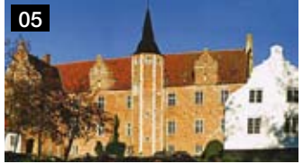
Danmarks Borgcenter Slotsruinen 1, DK-4760 Vordingborg Tel. +45 55 37 25 54 • www.museerne.dk