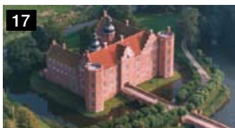
Clausholm Slot Clausholmvej 308, DK-8370 Hadsten Tel. +45 86 49 12 00 • www.clausholm.dk