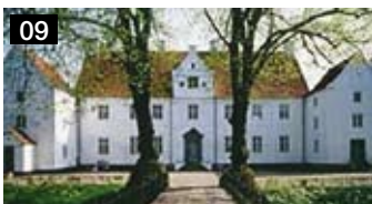
09 Museet på Sønderkov Sønderkovgårdsvej 2, DK-6650 Brørup Tel. +45 75 38 38 66 • www.sonderskov.dk